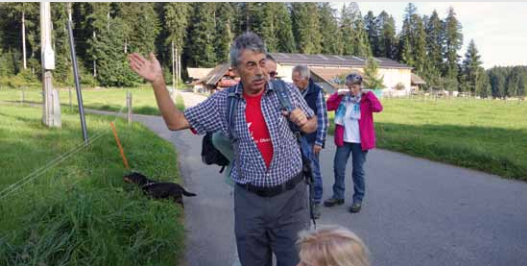
Herbstwanderung 2015: Hier gehts lang!