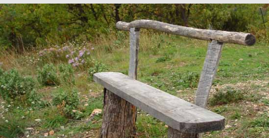
Bänke zum Verweilen – auch im Dorf